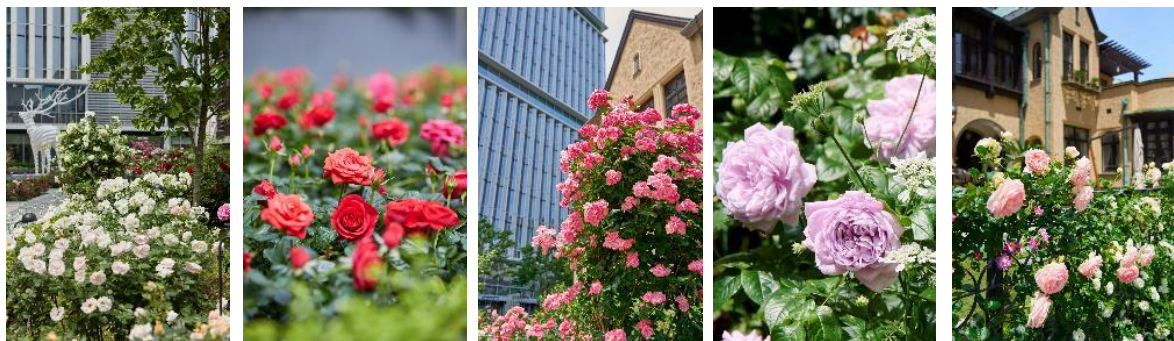
『KIOI ROSE WEEK 2023』を彩るバラ（一部） ※画像は過去のものです。

期間限定で開催される『KIOI ROSE WEEK 2023』で、バラと愛に溢れたひとときをお楽しみください。