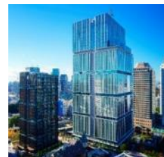
東京ガーデンテラス紀尾井町