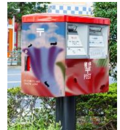
KIOI ROSE POST ※イメージ