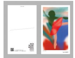
ポストカード ※イメージ